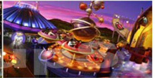
TOY STORY LAND